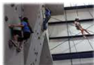
Muro de escalada